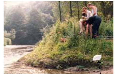
Tweede exemplaar te drogen gelegd

Het derde exemplaar probeerden we te dwingen met visgaren en stokjes, maar dat was allemaal te duidelijk zichtbaar. En ook dat exemplaar verdween ineens reddeloos.